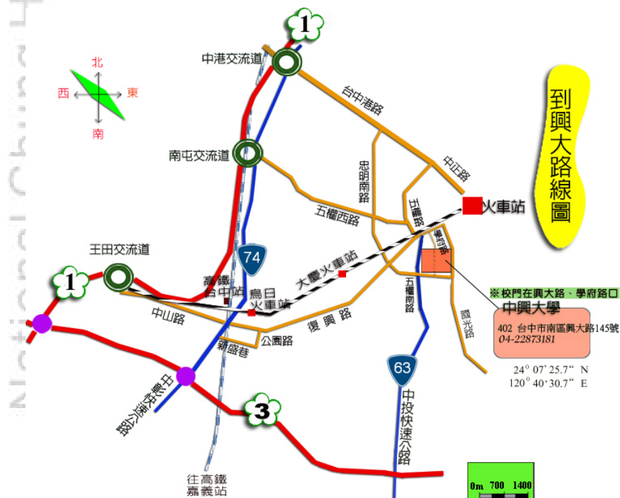
國立中興大學交通路線參考圖

(二)由 國道3號福爾摩沙高速公路 ： 209K 中投(台中)交流道下→接63線中投快速公路，往臺中市區方向→五權南路→忠明南路(右轉)→興大路(左轉)→中興大學。