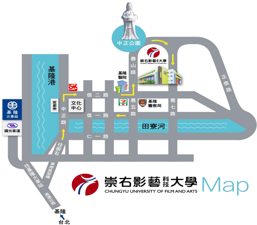
附件 7：崇右影藝科技大學位置圖