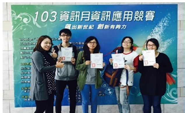
視覺傳達設計系學生榮獲 103 年資訊月資訊應用技能競賽「InDesign 尚介 IN 設計大賽」。