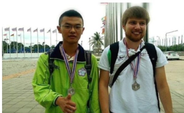
海洋運動休閒系學生榮獲「2015 年泰國身障桌球公開賽」TT11 組桌球雙打銀牌。