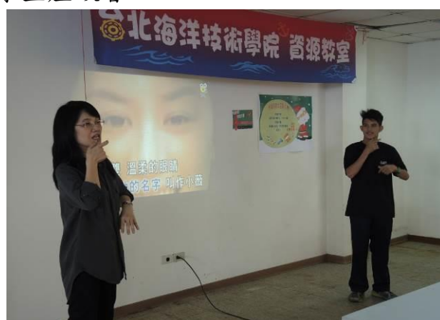
資源教室舉辦歌唱比賽，學生與手語老師一同演唱