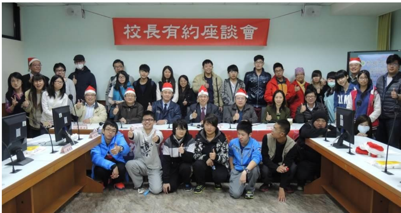
校長與身心障礙學生座談會