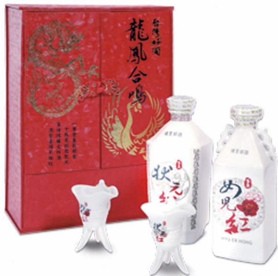
狀元紅、女兒紅各1瓶

以「狀元紅」及「女兒紅」組合，配上一對仿古磁杯，精緻喜氣包裝，猶如孩子中狀元或出嫁時，父母的期盼喜悅之情。附贈「加官進爵」仿古瓷三足爵瓷杯。