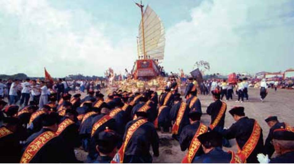
黃文博 臺南歸仁保西大人廟王醮諸會首送王 1999