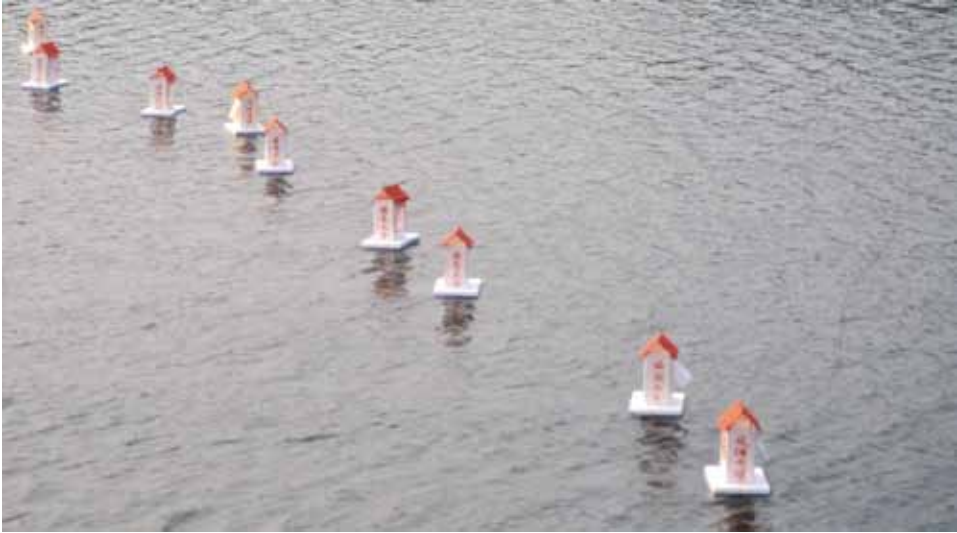
陳丁林 臺南安定長興宮放水燈 2003