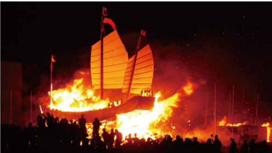
王素滿 臺南三寮灣東隆宮送王 2008

黃文博除鑽研民間信仰外，也熱愛拍攝雲嘉南濱海地區各種候鳥動態，更有鳥博士美譽。楊錦煌為了記錄王船文化，毅然從臺北搬到廟會活動較多的臺南，運用攝影專業技巧記錄王船影像、留住珍貴的文化資產。王素滿以攝影記錄自身家鄉的故事，臺南地區王船祭典亦為其拍攝重心之一。陳丁林長年記錄蘇厝長興宮王醮祭典，對於一般人難以瞭解的科儀法式有深入的研究，其於王府內拍攝的精彩照片，亦是瞭解王醮科儀神秘面貌的難得媒介。本次展覽匯聚眾多精彩影像，串聯影片和文物敘述臺灣民間信仰的豐富內涵，讓觀眾一窺王船文化的神祕世界。