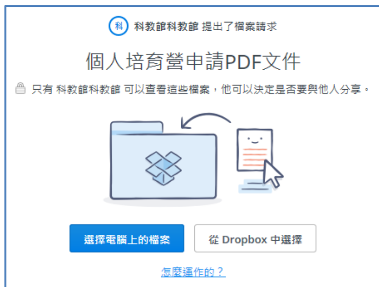
個人培育計畫申請 PDF 文件上傳示意圖