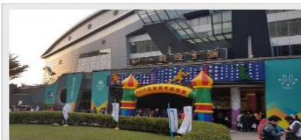
封測大廠美商艾克爾（Amkor）率封測業之先，今晚在竹北體育館舉辦年終晚會。

【記者洪友芳／新竹報導】農曆年節腳步將近，各公司紛將辦年終尾牙，台灣設立已逾17年的世界級封測大廠美商艾克爾（Amkor）率封測業之先，今晚在竹北體育館舉辦年終晚會，邀請金曲獎歌王蕭煌奇及動感歌手朱俐靜表演，現場由高階主管表演開場炒熱氣氛，並進行尾牙摸彩，最大獎20萬元，總獎金近700萬元。