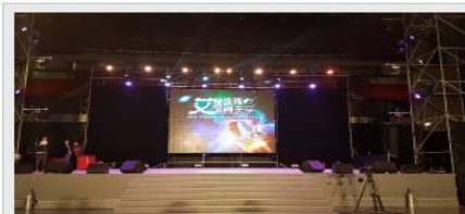
封測大廠美商艾克爾（Amkor）率封測業之先，今晚在竹北體育館舉辦年終晚會，最大獎20萬元，總獎金近700萬元。

艾克爾為全球第二大封測廠，在台灣擁有龍潭、湖口及先進等三廠，產品包括覆晶封裝、晶圓級封裝、晶圓凸塊、測試以及數位光源產品等，員工人數近4千人，公司自許擁有卓越的製造能力、領先市場的先進技術及品質第一的服務能力，滿足客戶需求。