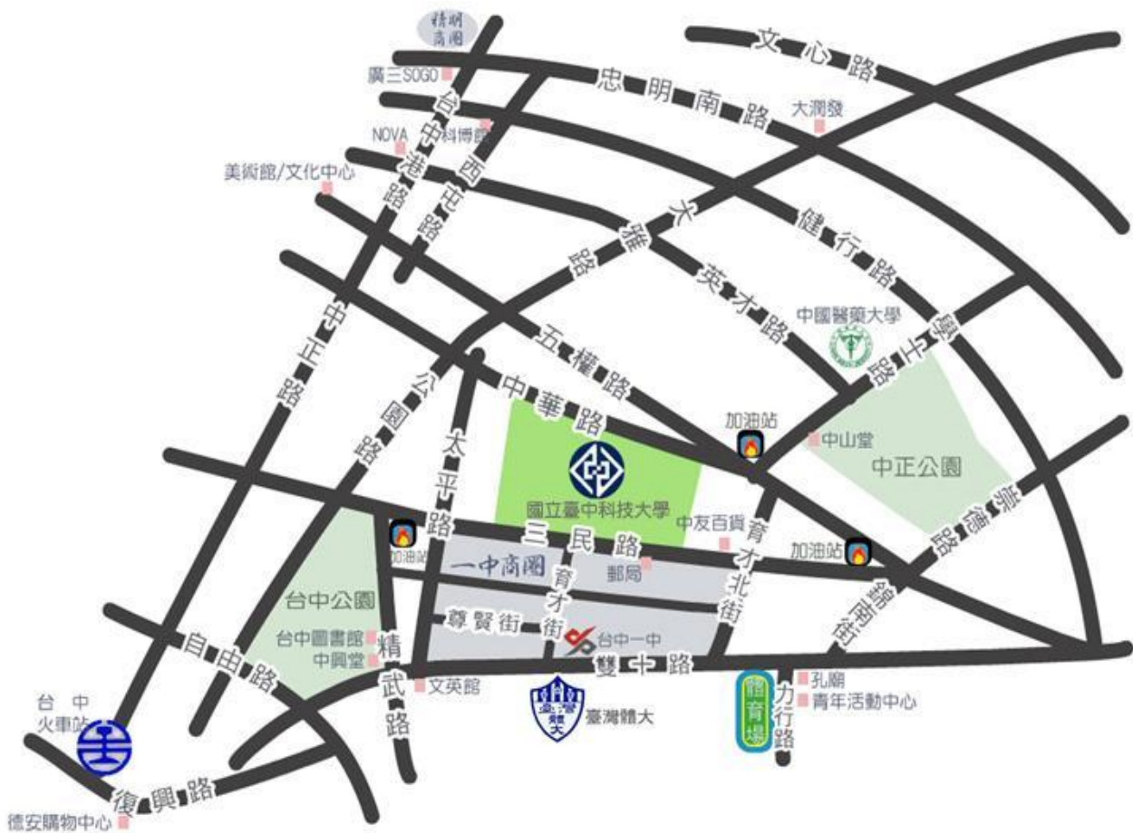
(國立臺中科技大學位置圖)