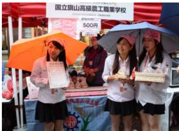
實體販賣活動現場