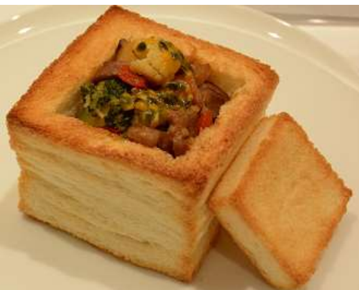
由專門業者將學生參賽菜單商品化呈現