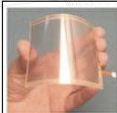
世界級化工新穎材料