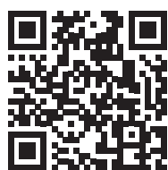
雲科大工管系學會 臉書粉絲專頁

國立雲林科技大學工業工程與管理系系辦公室 國立雲林科技大學工業工程與管理系系學會