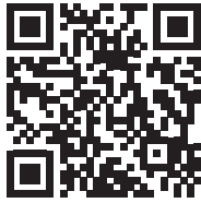
2017 寒假工管營 工啟 Dream