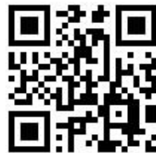
高雄住宅補貼 行動專區