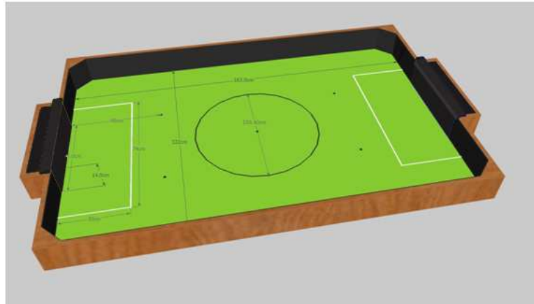
*圖 1：機器人足球場地示意圖，SuperTeam 尺寸會加大，若有些微誤差以比賽當天製作為主