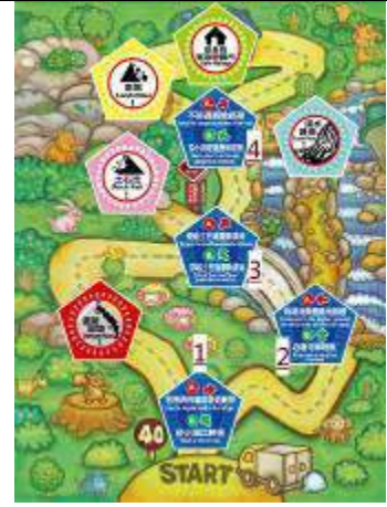
(上圖為所有磁鐵相對應擺放圖樣)

3. 再將五組鑰匙放置於左側箱面上，並將貼有 (R) 字樣的密碼鎖頭將遊戲箱上鎖，即準備完成。