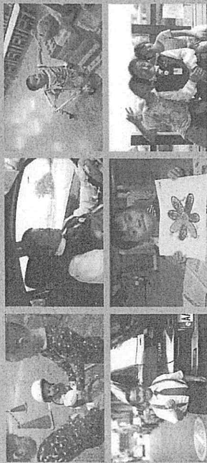
陳永旭導演「醫病關係」第14號作品